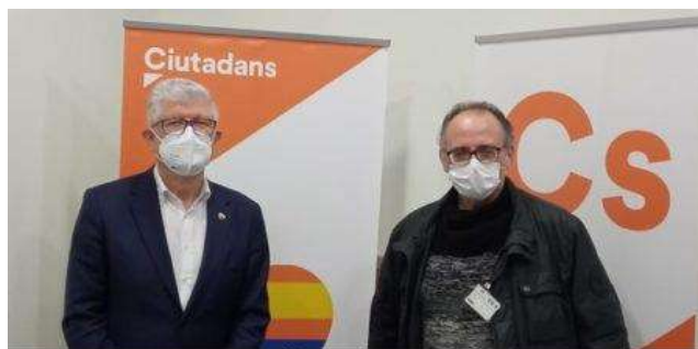
Derecha: Grupo Parlamentario Ciudadanos Parlament de Catalunya