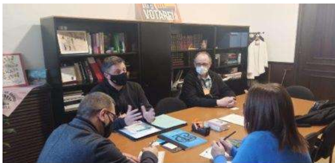
Izquierda: Grupo municipal Ciudadanos Ayto. Bcn